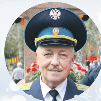
Леонид РЫБИН Депутат Совета депутатов города Новосибирска

От всей души поздравляем Вас с наступающим Новым годом и Рождеством Христовым!