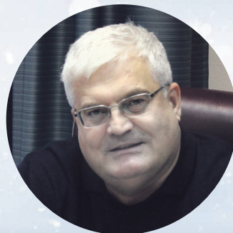
Вячеслав ИЛЮХИН Депутат Законодательного Собрания Новосибирской области